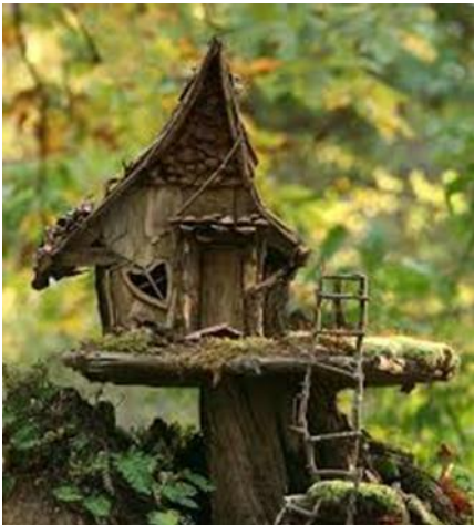
Claudia Andrae und Team

https://de.dreamstime.com/holzhaus-von-elfen-image130319702 und https://www.pinterest.it/pin/767441592723657384/ und https://www.pinterest.ch/pin/42854633934558979/